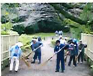
下原公会堂近辺緑道清掃