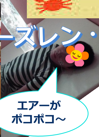
エアーがポコポコ～