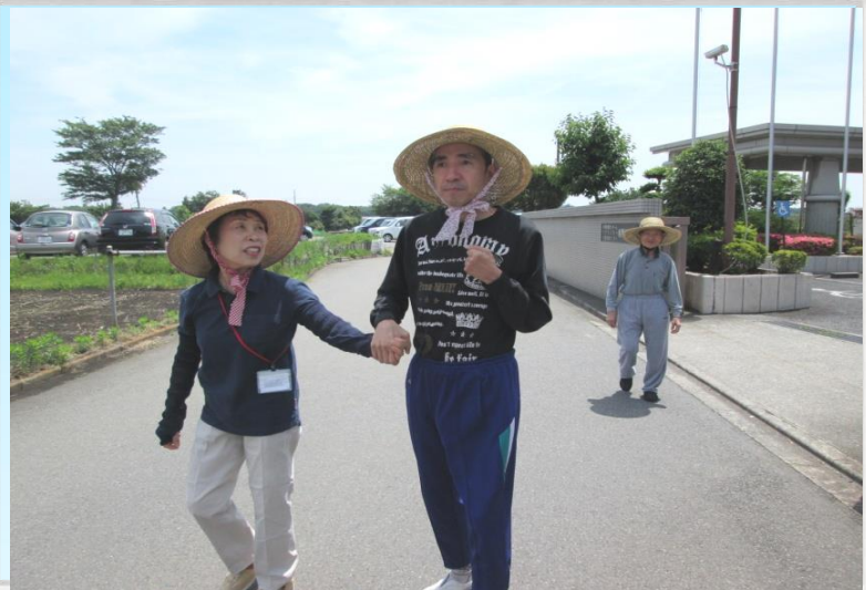
ウォーキングサークル