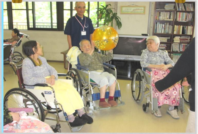
エクササイズサークル