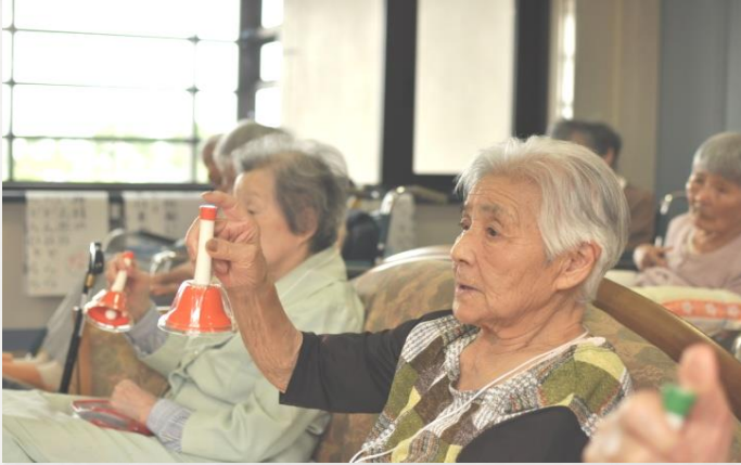
ミュージックサークル

相陽台ホームでは、日常生活の活発化を目的とし、 月・水・金曜日の週3回 、1時間アクティビティを行っています。